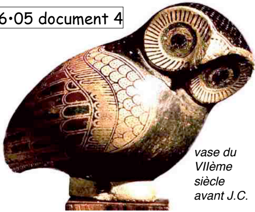
vase du VII ème siècle avant J.C.