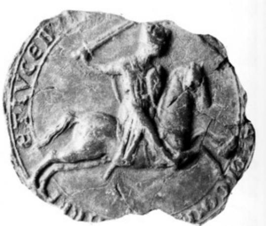
Sceau de Thiébaud I er , comte de Bar et de Luxembourg.

Il montre la représentation classique du chevalier cuirassé et armé, brandissant l'épée de la main droite et se protégeant de l'écu qui porte ou portera ses armoiries (1204, Arch. dép. Mame 22 H 49 n°4).