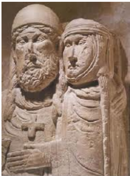
Hugues de Vaudémont neveu du Duc de Lorraine de retour de Croisade (il a vécu à la même époque que Renaud de Bar.