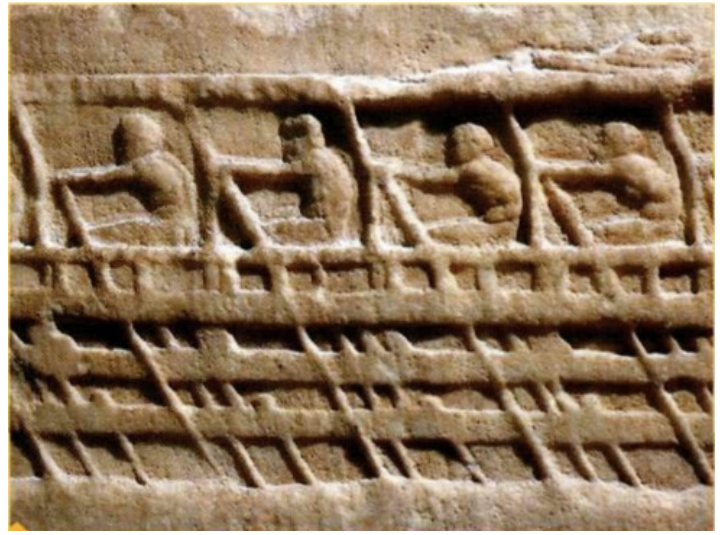
Détail d'un bas-relief en marbre, V siècle avant J.-C., musée de l'Acropole, Athènes.