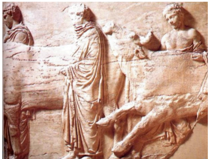
Fragments de la frise en marbre représentant la procession des Panathénées.