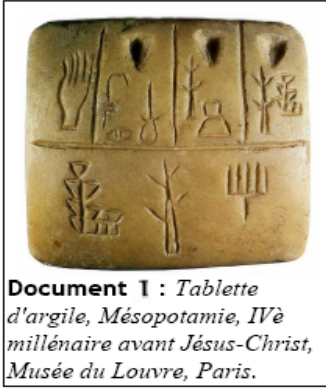
Document 1 : Tablette d'argile, Mésopotamie, IV e millénaire avant Jésus-Christ, Musée du Louvre, Paris.