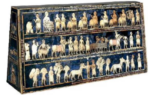
Document 1 : Etendard d'Ur, British Museum, Londres, vers 2650 avant Jésus-Christ